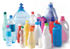
Bouteilles et bidons