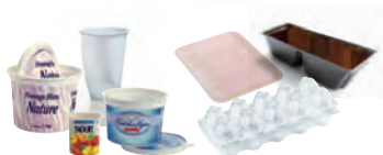
Pots et gobelets