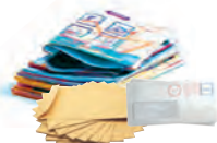
Journaux, magazines, enveloppes