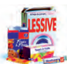
Boîtes et cartons d'emballage