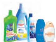
Flacons de produits ménagers et d'hygiène