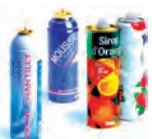
Bidons et aérosols (non dangereux)